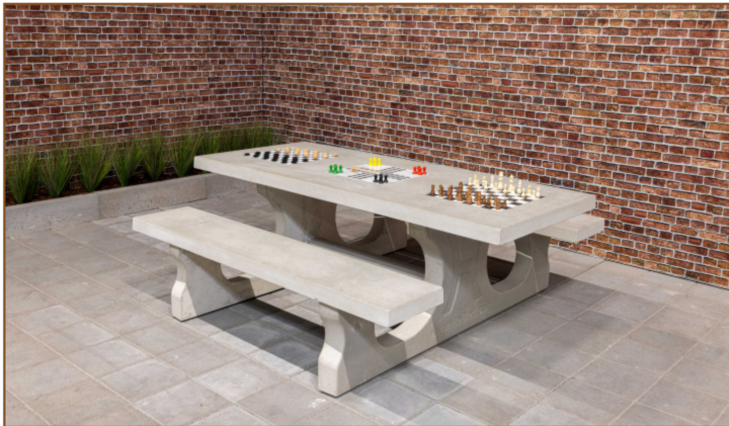
Table Multi-jeux (1-3-2) Standard Béton Naturel